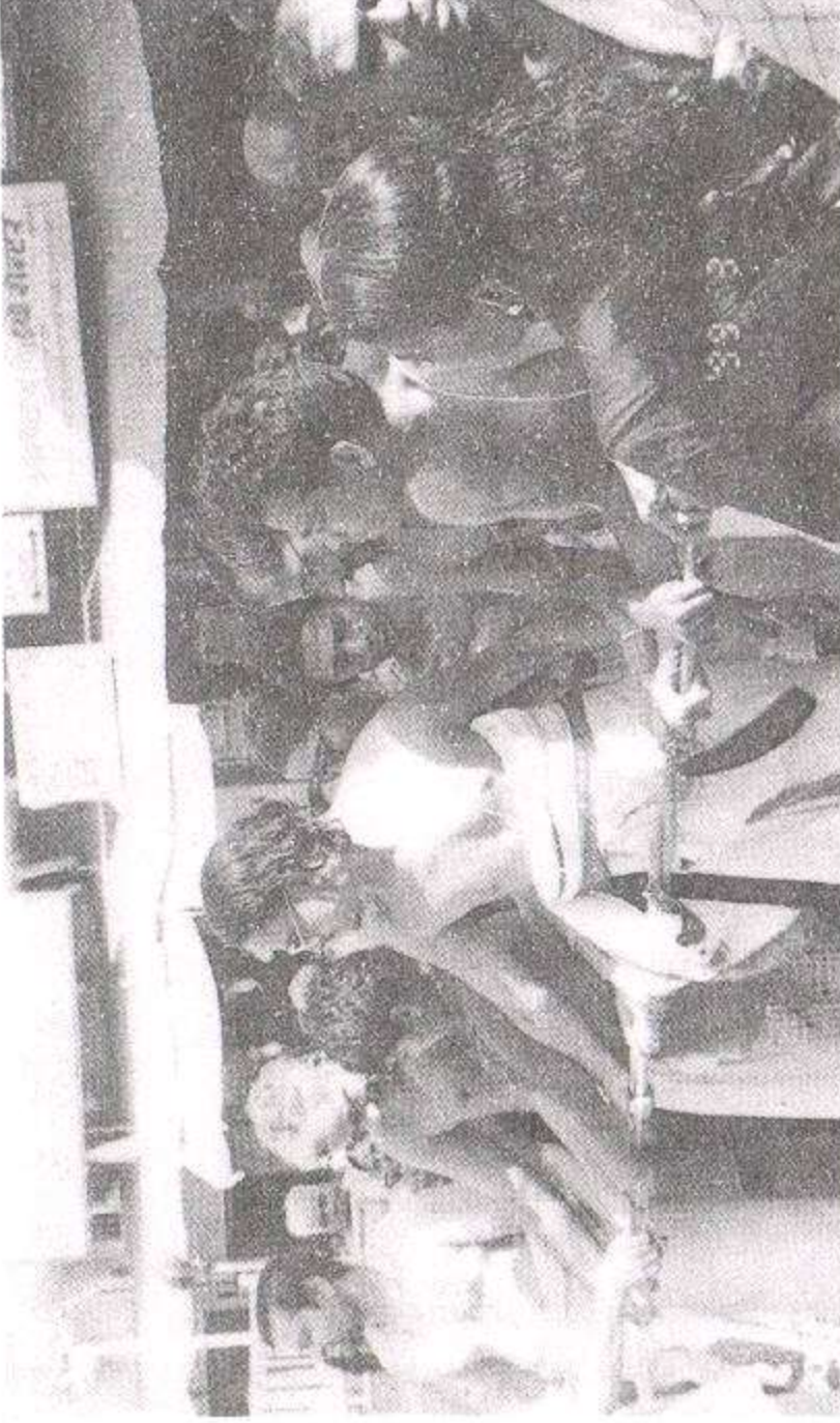
புஷ்கரில், ஸ்ரீவைகுண்டநாத பெருமாள் ரதத்தை வடம் பிடிக்கும் ஸ்ரீ ஸ்வாமிகளும் பக்தர்களும்.